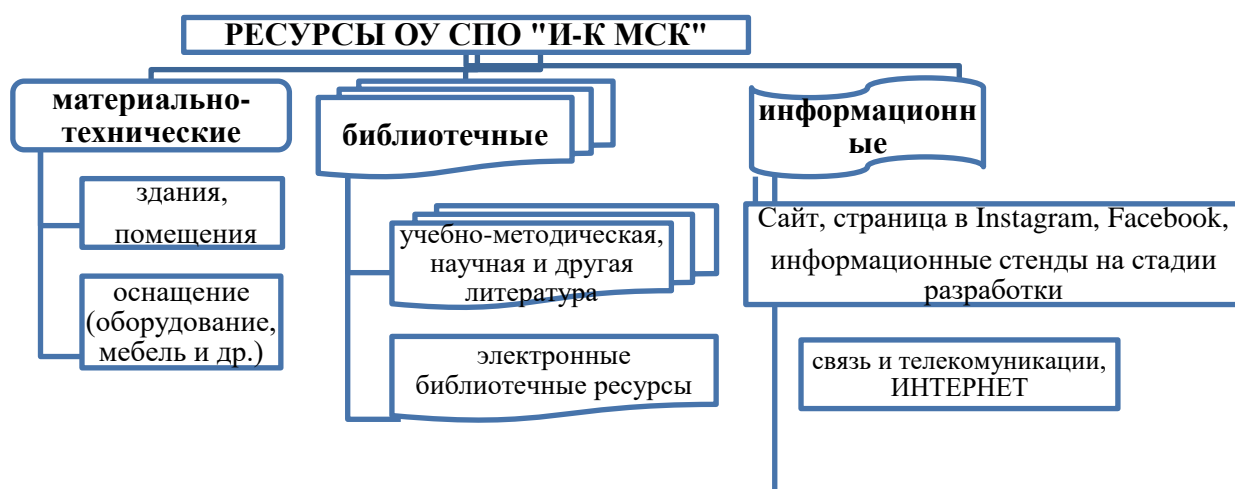
Рисунок 2. Структура ресурсов ОУ СПО «И-К МСК»

Структура материально-технической базы и информационных ресурсов ОУ СПО «И-К МСК» обусловлена содержанием государственных образовательных стандартов, требованиями служб государственного надзора, принципами государственной социальной политики КР. ОУ СПО «И-К МСК» имеет достаточные, адекватные и легкодоступные материально-технические и информационные ресурсы для качественного обеспечения образовательного процесса. Структура ресурсов ОУ СПО «И-К МСК» показана на рисунке 2.