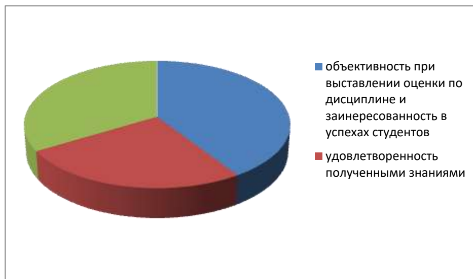
Рисунок 1. Оценка степени удовлетворенности студентов по категориям

Например в январе 2022 года было проведено анкетирование «Качество преподавания дисциплин глазами студентов ОУ СПО «И-К МСК»», в котором участвовало 30 студентов группы Ф-20. По таким вопросам, как: «Объективность при выставлении оценки по дисциплине и заинтересованность в успехах студентов», «Насколько Вы удовлетворены полученными знаниями, навыками по изученной дисциплине», «Ваши пожелания» результаты анкетирования по пяти балльной системе представлены на рис. 1